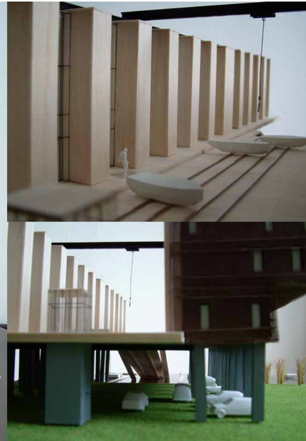
scheepshelling & parkeren