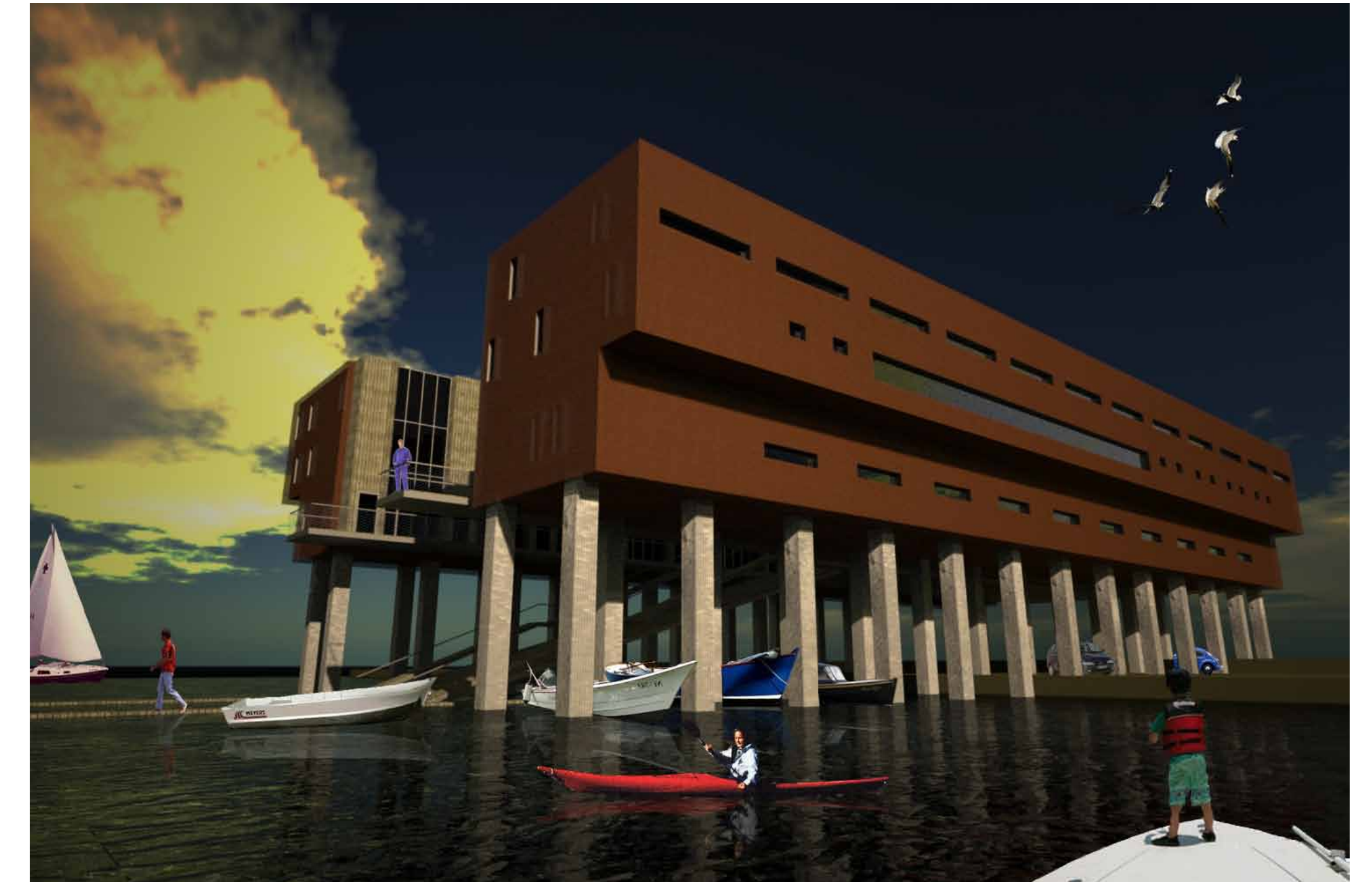
werfwoningen vanaf het water